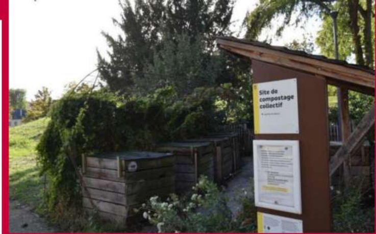
Réponses à l'enquête de mai 2024