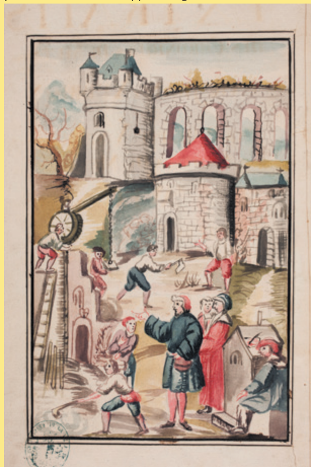
Un chantier de construction, illustration extraite des Chroniques de Philippe de Vigneulles. Collection des Bibliothèques-Médiathèques de Metz- MS 843

Lorry-lès-Metz « au fil du temps » vous attend nombreux pour commémorer Philippe de Vigneulles.