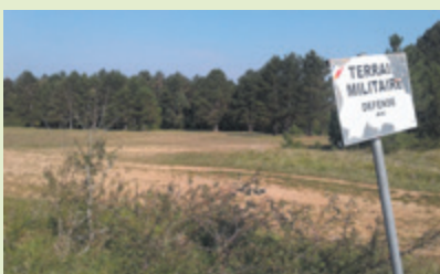
Les terrains ne seront plus militaires

puisque Metz Métropole a confié le portage foncier des terrains concernés à l'établissement public foncier de Lorraine (EPFL) ainsi que la conduite des opérations d'aménagement dits de sécurisation des ouvrages de défense. Pour la commune de Lorry-lès-Metz, deux secteurs sont concernés : le fort de Plappeville et sa route d'accès pour une superficie de près de 2 ha (photo) et le champ de manœuvre sur le plateau de Plappeville (la Côte, les Terres-Blanches, Sur-les-Carières) sur plus de 62 ha.