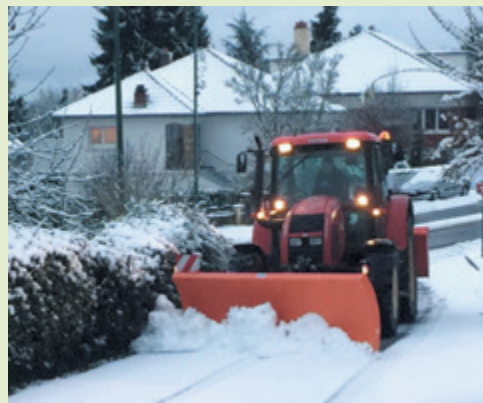
Pascal Guthmuller en action