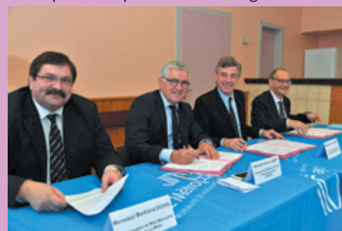
Signature de la convention

Dans ce projet structurant pour son territoire, Metz Métropole a investi 2 millions d'euros, qui ont fait l'objet d'environ 30 % de financement par l'Europe, l'État et la Région.