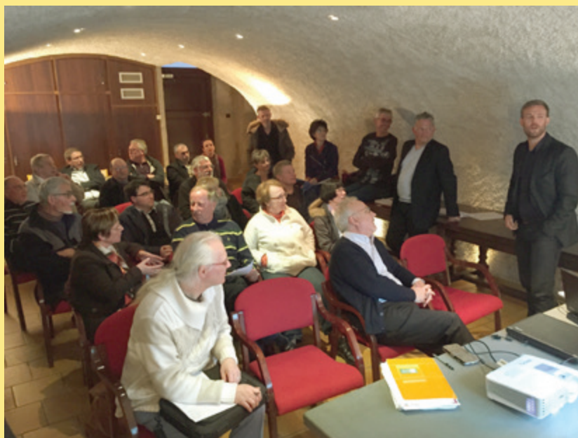
Présentation du projet aux associations

En outre, au-delà de son utilisation par les associations, d'autres usages liés aux écoles, activités et TAP des nouveaux rythmes scolaires, ainsi que la location pour les particuliers montrent la nécessité de réorganiser rapidement ce lieu. Cette réalisation sera la bienvenue et chaque Lorriot pourra y trouver son intérêt.